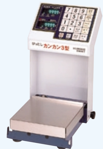
計量秤(びったしカンカン3型)