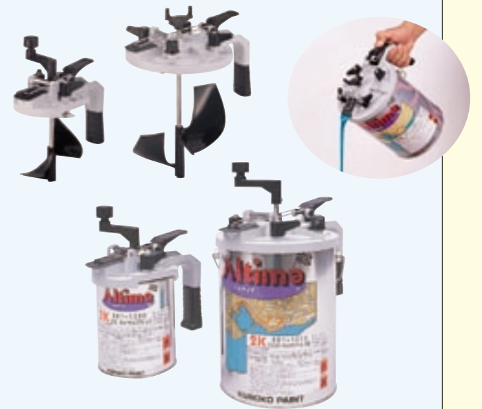
アジテーター(G・Q缶用)