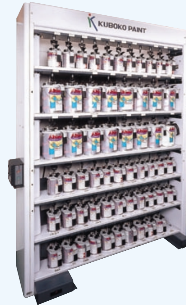
ミキシングマシン