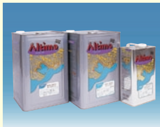
Nタイプは一般型、Sタイプは夏型です。